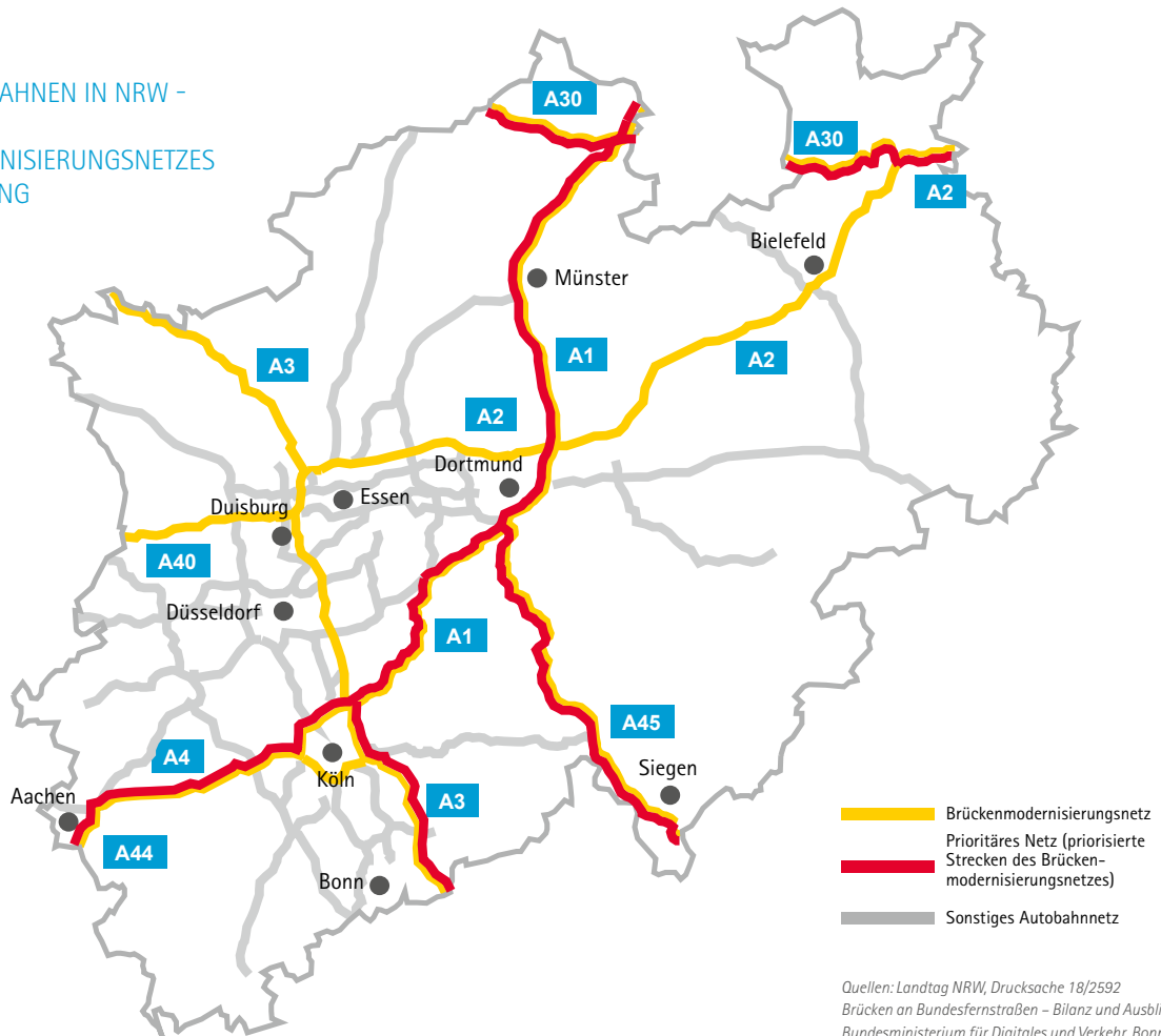
ABBILDUNG 1: NETZ DER AUTOBAHNEN IN NRW - ÜBERSICHT DES BRÜCKENMODERNISIERUNGSNETZES MIT PRIORISIERUNG

Das Brückensanierungsnetz umfasst bundesweit 54 Prozent aller Autobahn-Kilometer – in NRW sind es nur 34 Prozent.